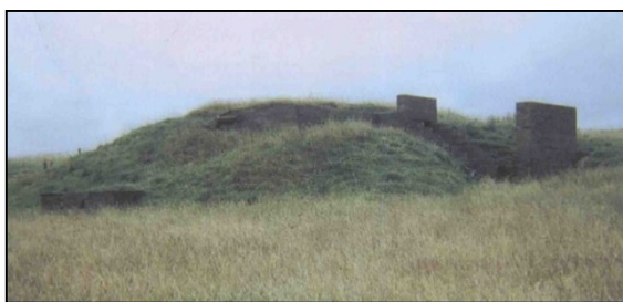
تصویر ۸- استتار و اختفای مکان‌های با درجه اهمیت (عباسپور، ۱۳۸۴)

اختفا ۱۸ : پنهان‌سازی فضاها و کالبد ساختمان‌ها (به خصوص مکان‌های با درجه امنیتی و ایمنی بالا) از اموری است که پیوسته مورد دغدغه بهره‌برداران این مکان‌ها بوده‌است. یکی از روش‌های مرسوم در پنهان‌سازی، بهره‌گیری از پوشش فضای سبز است. «جهت کارایی بیشتر طرح اختفا بهتر است همزمان با ساخت مراکز حیاتی و حساس فضای سبز نیز ایجاد گردد» (پدافند غیرعامل، ۱۳۸۵).