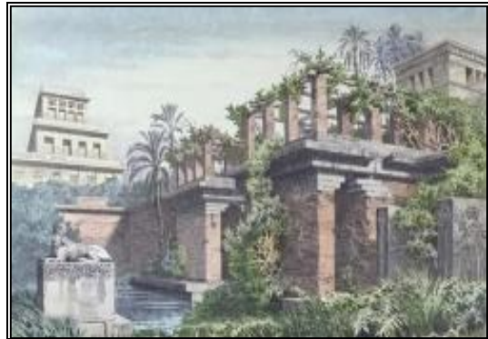
تصویر ۱- باغ‌های معلق بابل

بام‌های سبز و بدنه‌های سبز پدیده‌های جدیدی نیستند. آن‌ها به وسیله تجربه و تکنیک‌های ساختمانی کارآمد، طی صدها و حتی هزاران سال، در بسیاری از کشورها مطرح شده‌اند و اساساً به دلیل کیفیت عایق بسیار خوب، از ترکیب گیاه و لایه خاک، ایجاد می‌شوند. آن‌ها در اقلیم‌های سرد، کمک به حفظ گرمای درون ساختمان و در آب و هوای گرم، کمک به جلوگیری از نفوذ گرما به درون ساختمان می‌کنند. اولین بام سبز گزارش شده در تاریخ بشری باغ‌های معلق بابل در ایران باستان است. این باغ‌ها از عجایب عالم و از شاهکارهای معماری بودند. این باغ‌ها به روایتی دارای ۵ تراس مطبق بودند.