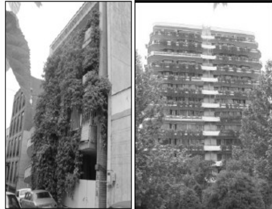
تصویر ۳- مجتمع‌های مسکونی نیاوران ساختمانی در خیابان شهید مطهری