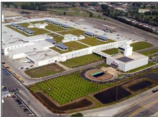
تصویر ۵- تصاویری از بام‌های سبز گسترده

فیزیکی و شکل ظاهری اهداف و همگونی آن‌ها با محیط اطراف» (پدافند غیرعامل، ۱۳۸۴) در طرح‌های پدافند غیرعامل مدنظر است، بام سبز متمرکز بیشتر می‌تواند ما را در رسیدن به این اهداف یاری رساند.