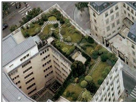
تصویر ۶- تصویر از باغ بام

فیزیکی و شکل ظاهری اهداف و همگونی آن‌ها با محیط اطراف» (پدافند غیرعامل، ۱۳۸۴) در طرح‌های پدافند غیرعامل مدنظر است، بام سبز متمرکز بیشتر می‌تواند ما را در رسیدن به این اهداف یاری رساند.