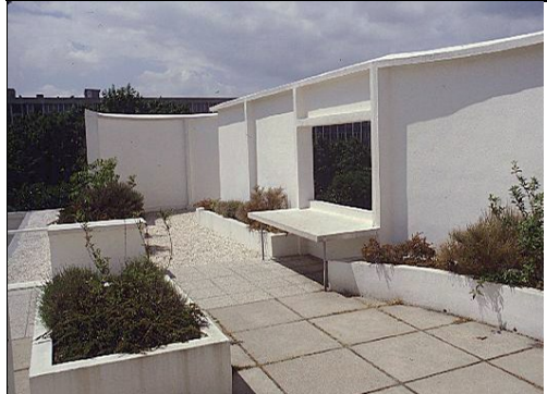
تصویر ۲- بام و نمای ساختمان ویلا ساووا

به نظر می‌رسد از نیمه قرن بیستم تا کنون، مردم و عرف ساخت و ساز محلی- منطقه‌ای شمال اروپا، مخصوصاً در آلمان، سوئیس، اتریش و منطقه