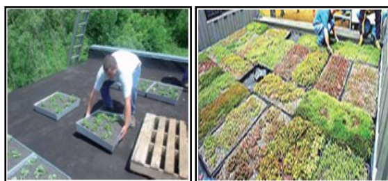
تصویر ۷- جزئیات اجرایی سیستم مدولار یا جعبه گیاه

استتار ۱۷ : از پوشش فضای سبز مواد طبیعی، در قالبدرخت و درختچه و گیاهان زمینی می‌توان به عنوان عوامل استتار بهره‌برداری نمود؛ زیرا «گیاهان، طبیعی‌ترین و ماندگارترین مصالح استتار هستند» (پدافند غیرعامل، ۱۳۸۵) و اگر این «مواد طبیعی، به طور صحیح مورد استفاده قرار گیرند، یک پوشش و مانع خوبی در مقابل دید مستقیم و عکس‌های هوایی ایجاد می‌کنند» (پدافند غیرعامل، ۱۳۸۸).