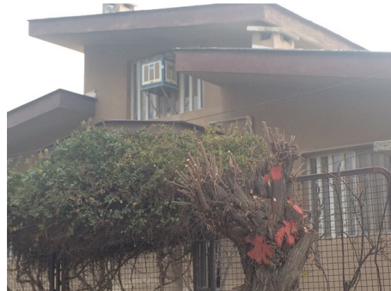
شکل ۱- نمونه بام‌های شیب‌دار در منطقه